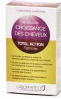
Total Action croissance des cheveux Croissance des Cheveux Femmes cure 1 mois 19.90€

BEAUTÉ CHEVEUX : Pour lutter contre la chute de cheveux chez l'homme et la perte des cheveux chez la femme, ces traitements stimulent le cuir chevelu et redonnent volume, brillance et éclat à la chevelure.