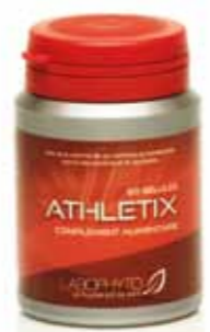
Masse musculaire et Tonus Athletix 60 cure 1 mois 19.90€

ÉNERGIE : Une gamme qui redonne vitalité et énergie. Elle aide à réduire la fatigue physique et mentale en stimulant l'organisme pour le booster.