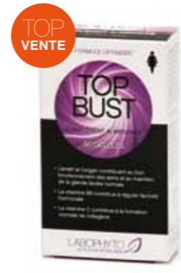
Poitrine Formule optimisée TopBust Végétaux et vitamines contribuent au bon fonctionnement des seins et au maintien de la glande lactée normale. 24.90€

BEAUTÉ POITRINE : Labophyto propose un complément alimentaire à base de fenugrec et de fenouil afin d'augmenter le volume de ses seins sans chirurgie. Grâce à ce traitement à base de produits naturels qui stimulent la glande lactée, la poitrine sera plus tonique, et les seins plus ronds.